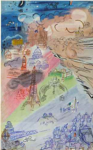
ラウル・デュフィ《電気の精》(部分) 1953年