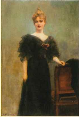
アンリ・ジェルベクス 《金曜日の宵》 1900年頃

本展では、大胆な表現力でポスターを芸術の域まで高め、後世に大きな影響を与えた画家・トゥールーズ=ロートレックを中心に、ミュシャやドガ、デュフィら同時期の画家たちの作品を展観。ベル・エポックを象徴する女性のファッション、人々の生活、劇場や盛り場など華やかな時代の姿を映し出したパリの芸術を紹介します。