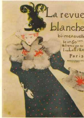
アンリ・ド・トゥールーズ=ロートレック 《『ラル・ヴュ・ブランシュ』誌》 1895年