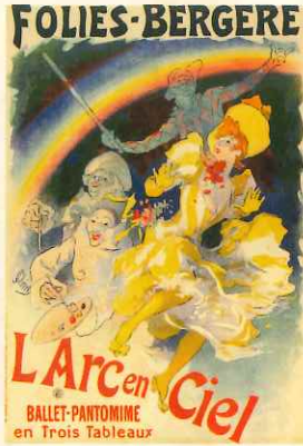
ジュール・シェレ 《「虹」フォーリー・ベルジェール》 1893年