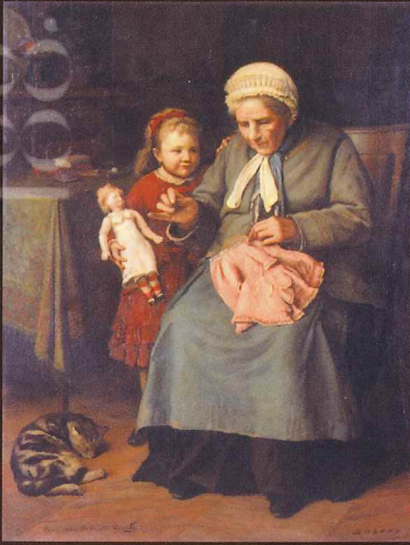
五姓田義松《人形の着物》 油彩・カンヴァス

このたびの展覧会では、笠間日動美術館(茨城県)の所蔵品から日本洋画の父ともいわれる高橋由一、五姓田義松をはじめ、日本近代洋画の礎を築いた黒田清輝、藤島武二、浅井忠、青木繁、そして戦後の具象彫刻をリードした舟越保武など、明治から現代にいたる画家・彫刻家の作品を紹介します。日本近代美術史に名を遺す巨匠たちの作品を観し、日本洋画の歩みを辿ります。