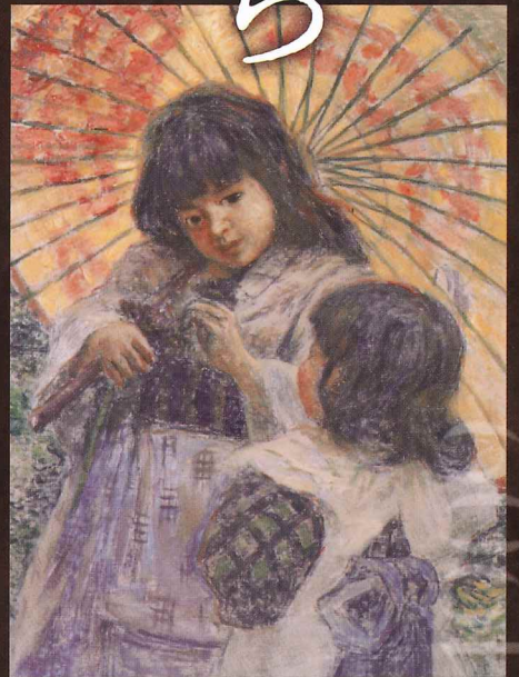
青木繁《二人の少女》 油彩・カンヴァス

江戸時代後期から明治にかけて西洋から渡ってきた絵画は、日本の美術界に大きな変化を与えました。追真的な写実表現に強い衝撃を受けた当時の画家たちは、苦心しながらも手探りでその画法を学びます。明治になると、多くの画家たちがヨーロッパに留学するようになり、西洋絵画の基礎を学んだ画家たちは日本に本格的な洋画をもたらし、また東京美術学校で後進を育成するなど、日本の近代洋画に大きな影響を与えました。大正に入ると、自由主義な時代の風が登場します。このようななかで、フランスで前衛的な美術表現に触れ帰国した画家たちが日本で新たな美術表現を生み出し、大正から昭和にかけて絵画は豊かな展開をみせました。