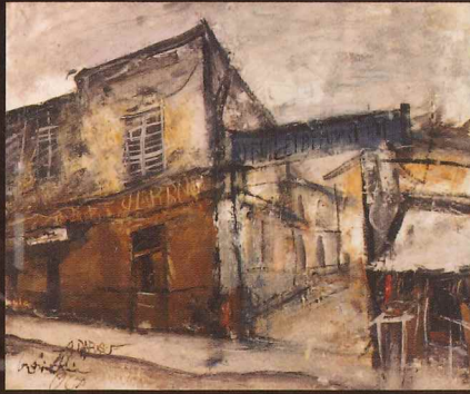
佐伯祐三《パリの街角》 油彩・カンヴァス

このたびの展覧会では、笠間日動美術館(茨城県)の所蔵品から日本洋画の父ともいわれる高橋由一、五姓田義松をはじめ、日本近代洋画の礎を築いた黒田清輝、藤島武二、浅井忠、青木繁、そして戦後の具象彫刻をリードした舟越保武など、明治から現代にいたる画家・彫刻家の作品を紹介します。日本近代美術史に名を遺す巨匠たちの作品を観し、日本洋画の歩みを辿ります。