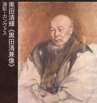
黒田清輝《黒田清兼像》 油彩・カンヴァス