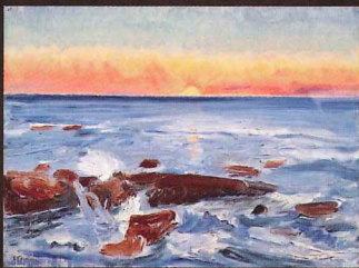
藤島武二《日の出》 油彩・カンヴァス