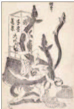
《鰻登り》十二編 後期