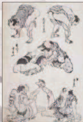
《尻相撲・座相撲・足相撲》十一編 後期