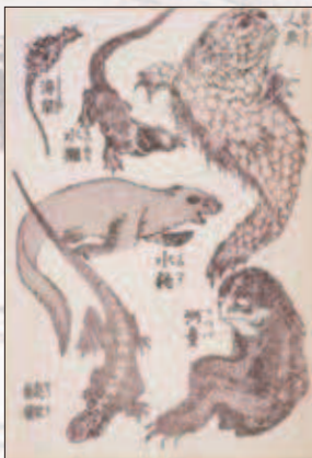
《人魚・河童ほか》三編 後期