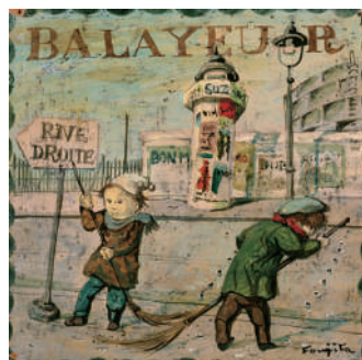
《掃除夫》『小さな職人たち』1959年頃 ボーラ美術館蔵