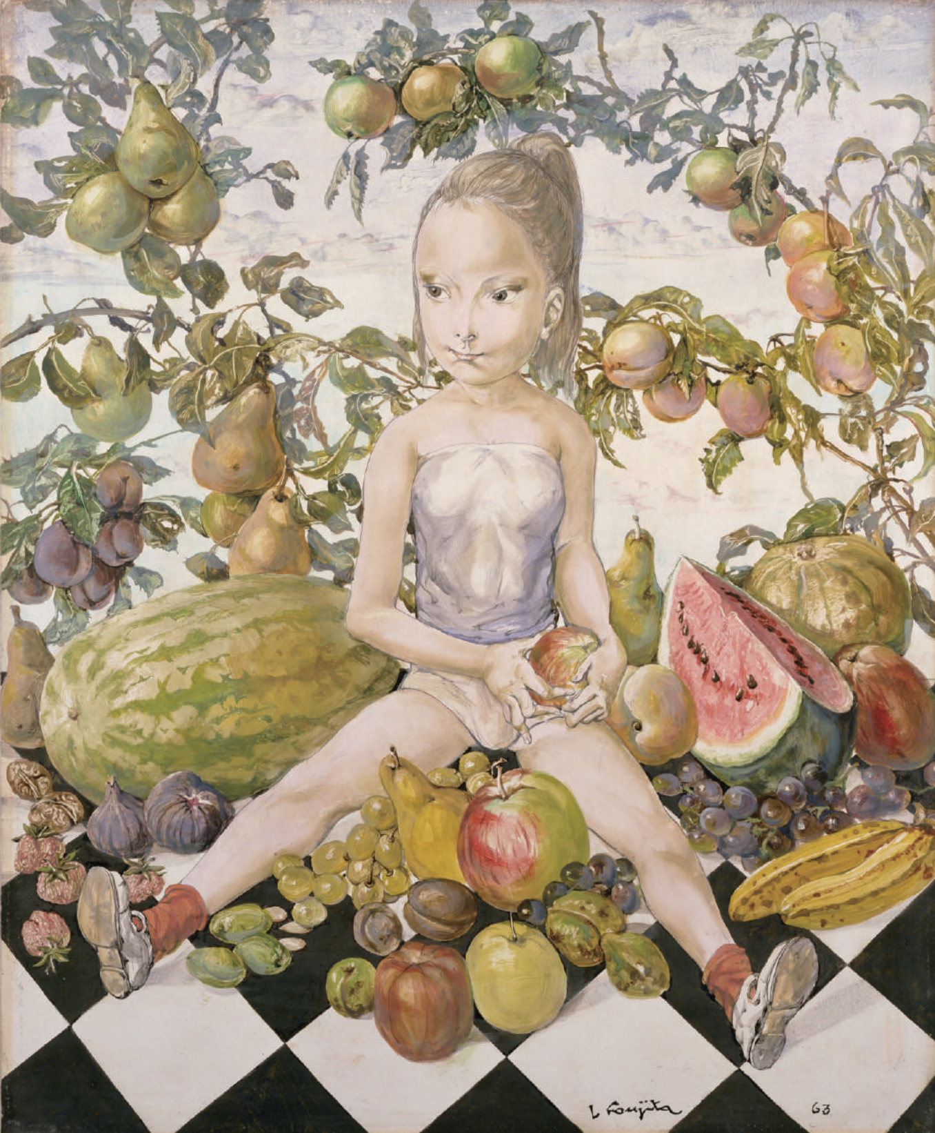
《少女と果物》1963年 ポーラ美術館蔵