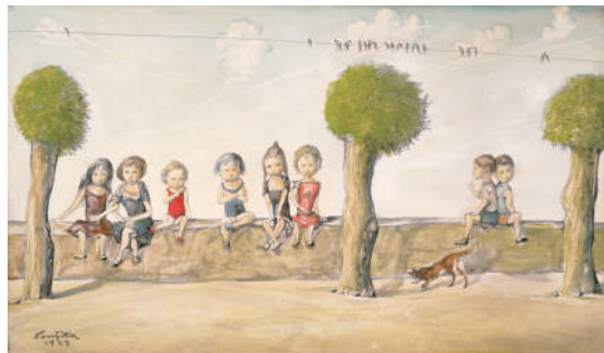
《つぼめと子供》1957年 ボーラ美術館蔵