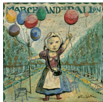
《風船売り》『小さな職人たち』1959年頃 ボーラ美術館蔵

作品は全て©Fondation Foujita / ADAGP, Paris & JASPAR, Tokyo, 2022 E4733