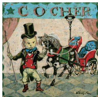
《御者》『小さな職人たち』1959年頃 ボーラ美術館蔵