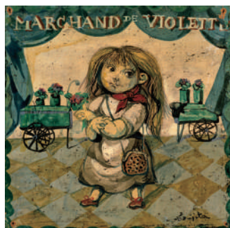
《すみれ売》『小さな職人たち』1959年頃 ボーラ美術館蔵