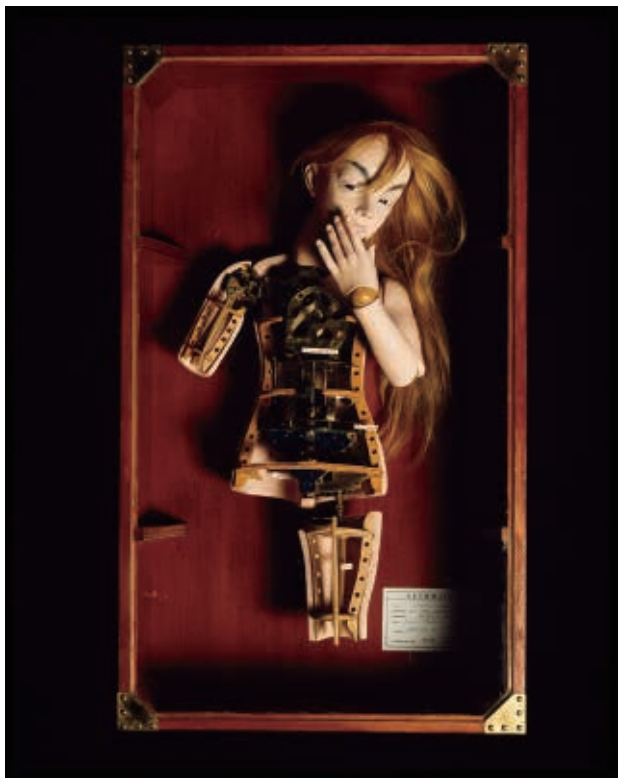
四谷シモン 機械仕掛けの少女1 1979/83年 なるせ美術館蔵