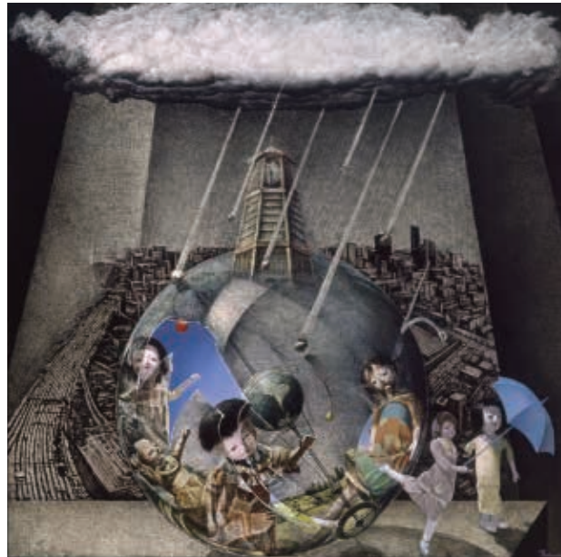
加藤貞子 雨の降る石 1988年 作家蔵(秋田県立近代美術館寄託)