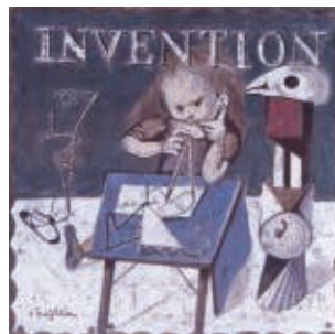
藤田嗣治 発明(四十雀)より 1963年(公財)平野政吉美術館蔵 ©Fondation Foujita/ADAGP,Paris&JASPAR,Tokyo,2017 E2848