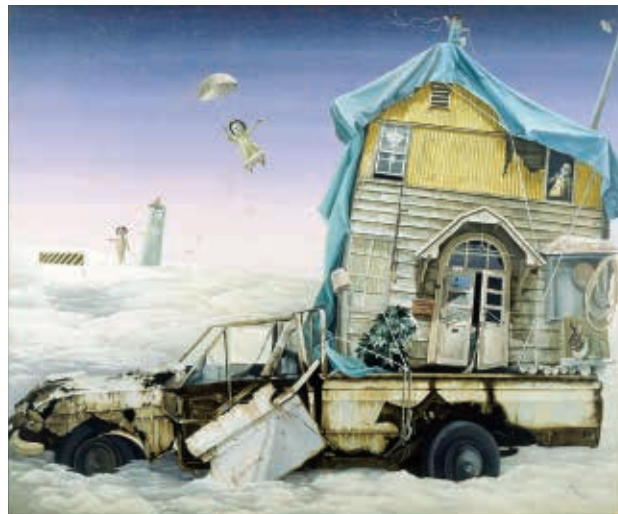
加藤貞子 ひっこし車は空の上 1985年 秋田市立千秋美術館蔵