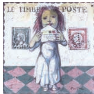
藤田嗣治 切手(四十雀)より 1963年(公財)平野政吉美術館蔵 ©Fondation Foujita/ADAGP,Paris&JASPAR,Tokyo,2017 E2848