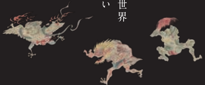
「百鬼夜行絵巻」江戸時代後期(国学院大学図書館蔵)より