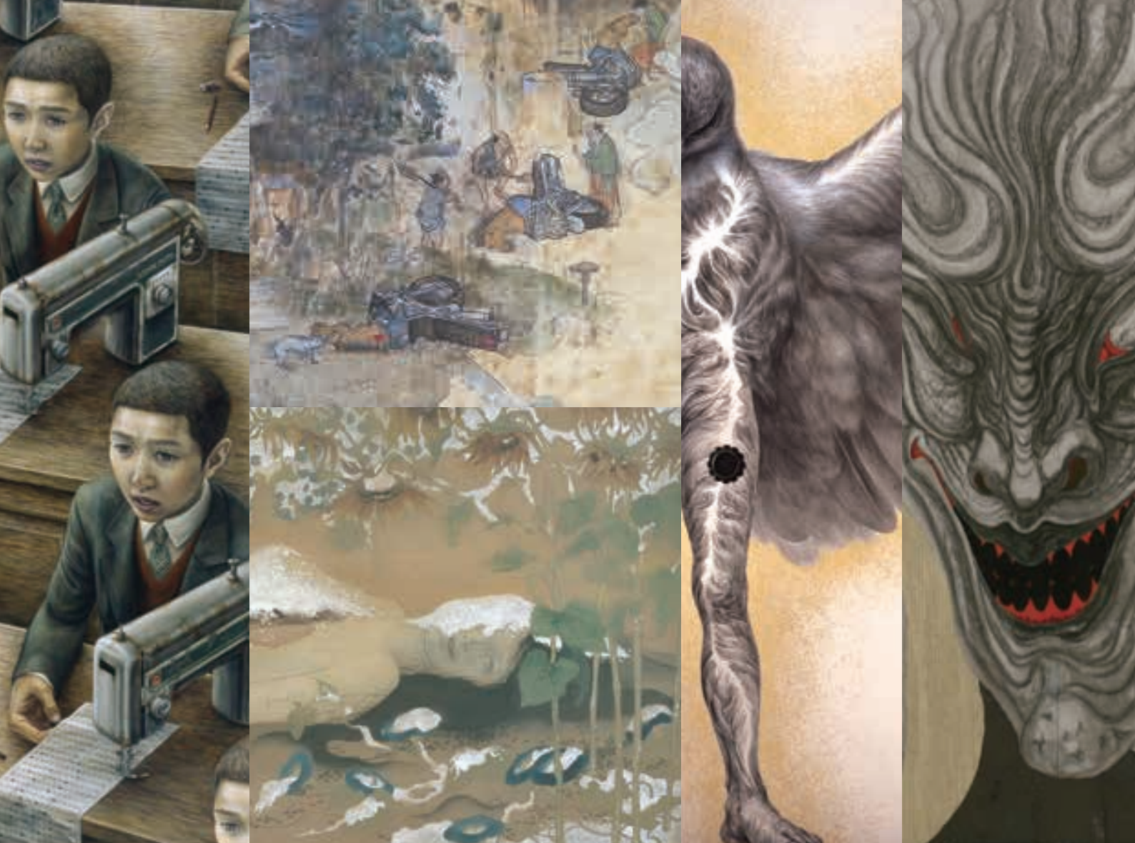
石田徹也《無題》1997年頃(部分) 東京国立近代美術館蔵