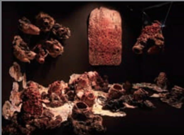
呉島直子 展示風景(TWD-ART エルビスの空) TOKYO DESIGNERS WEEK 2011 撮影:宮島径 ©MAJIMA Naoko, Courtesy Mizuma Art Gallery