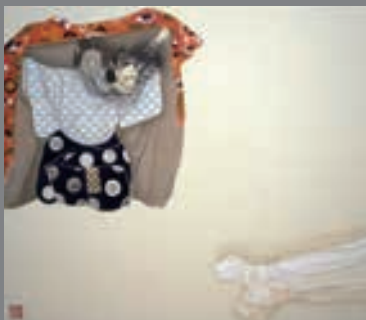
山本太郎《天上ネグリジェ》2012年 ©Taro YAMAMOTO, Courtesy of imura art gallery