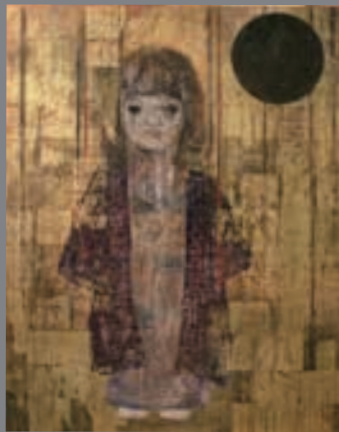
金子富之《小雨》2012年 増田友弥蔵