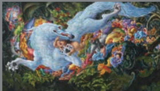
岡本瑛里《かやせ、もどせ》2010年(部分) 東京都台東区蔵 撮影:宮島径 ©OKAMOTO Ellie, Courtesy Mizuma Art Gallery