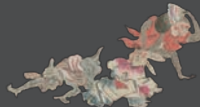
「百鬼夜行絵巻」江戸時代後期(國學院大學図書館蔵)より

7月16日(土) 10:30~11:30 7月31日(日) 14:00~15:00 8月14日(日) 14:00~15:00 8月28日(日) 14:00~15:00 ※事前申込不要。観覧券または年間パスポートが必要です。