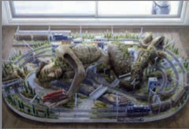
石田徹也《捜索》2001年 第一生命保険株式会社蔵