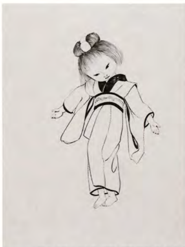
ジャン・コクトー著、藤田嗣治挿画『海龍』より 1955年 個人蔵