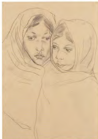
《メキシコでの素描(女2人)》1933年頃 公益財団法人平野政吉美術財団蔵

対象の核心に迫り、画面にいのちを与える、藤田の線の魅力を感じていただければ幸いです。