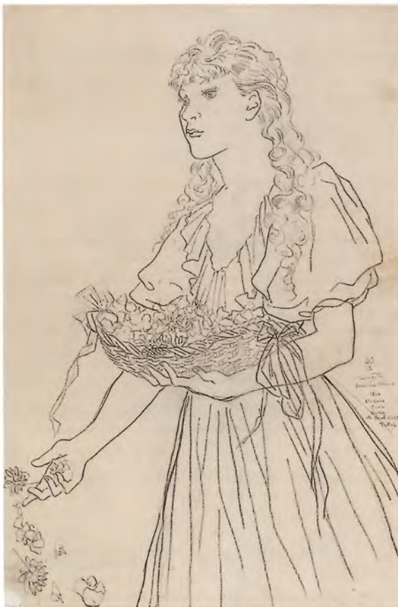
《マドレーヌ像 花をまく》1934年 公益財団法人平野政吉美術財団蔵