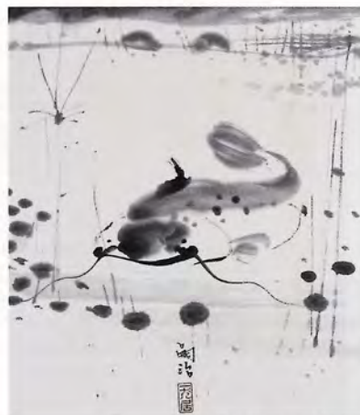
《鯉》1936年 秋田県立近代美術館蔵