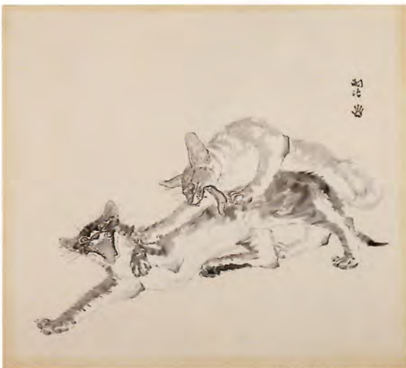
《幽霊》1936年 秋田県立近代美術館蔵