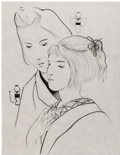
ジャン・コクトー著、藤田嗣治挿画『海龍』より 1955年 個人蔵