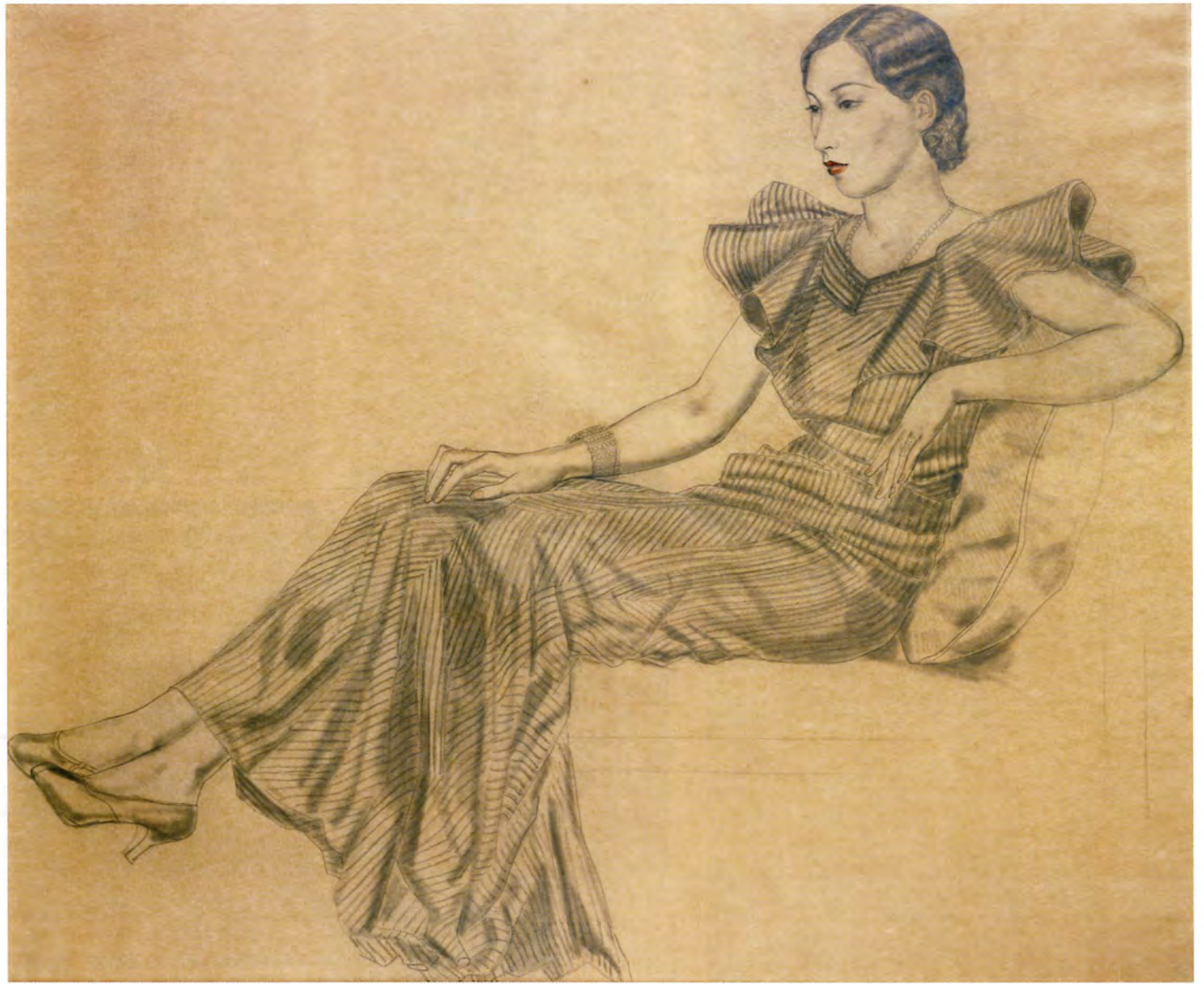
〔Y夫人肖像〕1935年 公益財団法人平野政吉美術財団蔵 ©Fondation Foujita / ADAGP, Paris & JASPAR, Tokyo, 2016 E2389